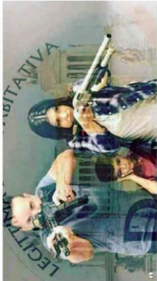
1) La foto di copertina del gruppo Facebook "Aggiunta di licenze sportive" 2) Un utente chiede commenti sulla sua pistola; 3) Una domanda sul porto di armi