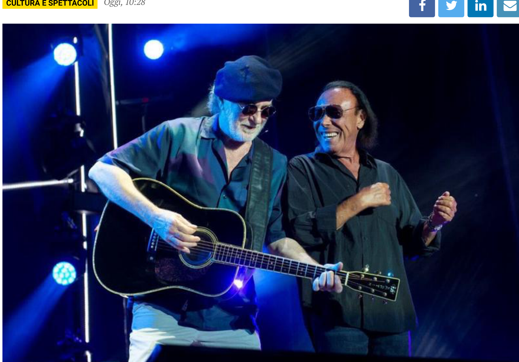
Francesco De Gregori e Antonello Venditti insieme sul palco

Due artisti di capitale importanza per il cantautorato italiano, spalla a spalla in uno show unico. Il Brescia Summer Music si chiude stasera con un evento d'eccezione, il concerto di Antonello Venditti e Francesco De Gregori .