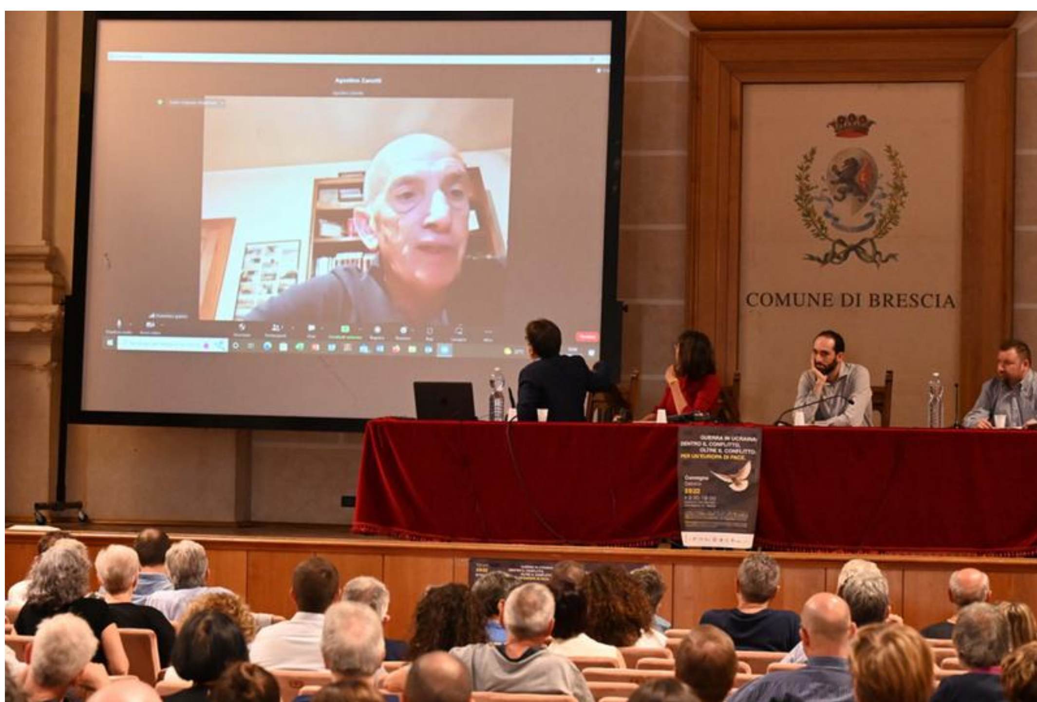
Domenico Quirico in video collegamento al San Barnaba

«Il tema della guerra in Ucraina è enorme. Direi tolstoiano e, sostanzialmente, insolubile . Una guerra impossibile, di fatto iniziata nel 2014. Abbiamo preferito non vedere , allora, ma quello che è accaduto è stata una delle ragioni che hanno portato alla svolta drammatica di questo 2022».